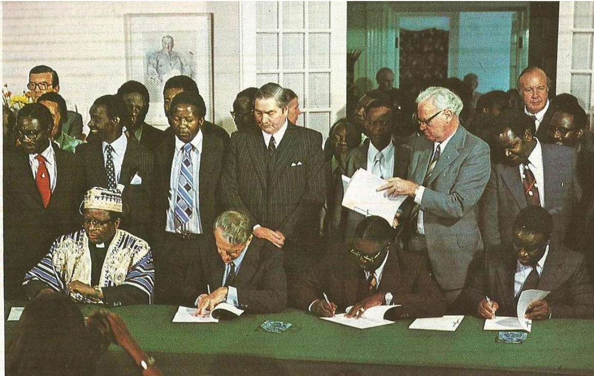
De ondertekening. Van links naar rechts: Bisschop Abel Muzorewa, Ian Smith, Jeremiah Chirau en Ndabaningi Sithole.

De met de ondertekening gevormde overheid slaagt er niet in om de vrede te bewaren of internationale erkenning te verkrijgen, en in 1979 komt Rhodesië weer tijdelijk onder Britse controle als voorbereiding op verkiezingen. In 1980 wordt Robert Mugabe verkozen tot de eerste regeringsleider van Zimbabwe.