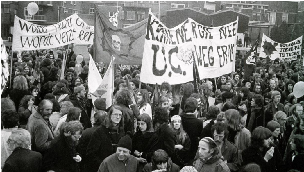
De demonstratie in Almelo

uranium aan Brazilië. De demonstratie is deels succesvol: de levering aan Brazilië gaat niet door. De uitbreiding van de fabriek wordt echter wel doorgezet.