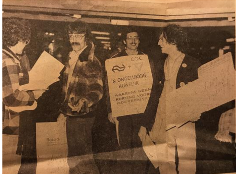
De actie van de Roze Driehoek

De ophef is niet alleen vanuit principieel oogpunt te verklaren: ook financieel gezien is de ophef begrijpelijk. Een gezinsabonnement kost 2340 gulden voor een jaar, terwijl twee mensen die samenwonen of een relatie hebben (maar geen huwelijk) per persoon 2200 gulden betalen, de normale individuele prijs. Dat scheelt dus 2100 gulden in het voordeel van mensen die getrouwd zijn. In november volgen verschillende acties, waaronder het idee om gratis de trein te nemen op 1 november. Later die maand wordt er op verschillende stations gedemonstreerd. De acties zijn georganiseerd door verschillende groepen, zoals het COC, de SVR, de Roze Driehoek, Man-Vrouw-Maatschappij, en verschillende vrouwengroepen.